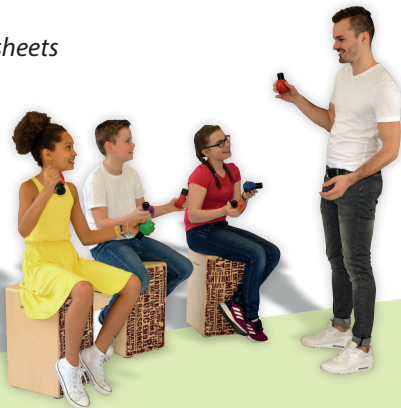
Accompaniment sheets on different levels

The color of the caps indicates the tones in the respective pitch: